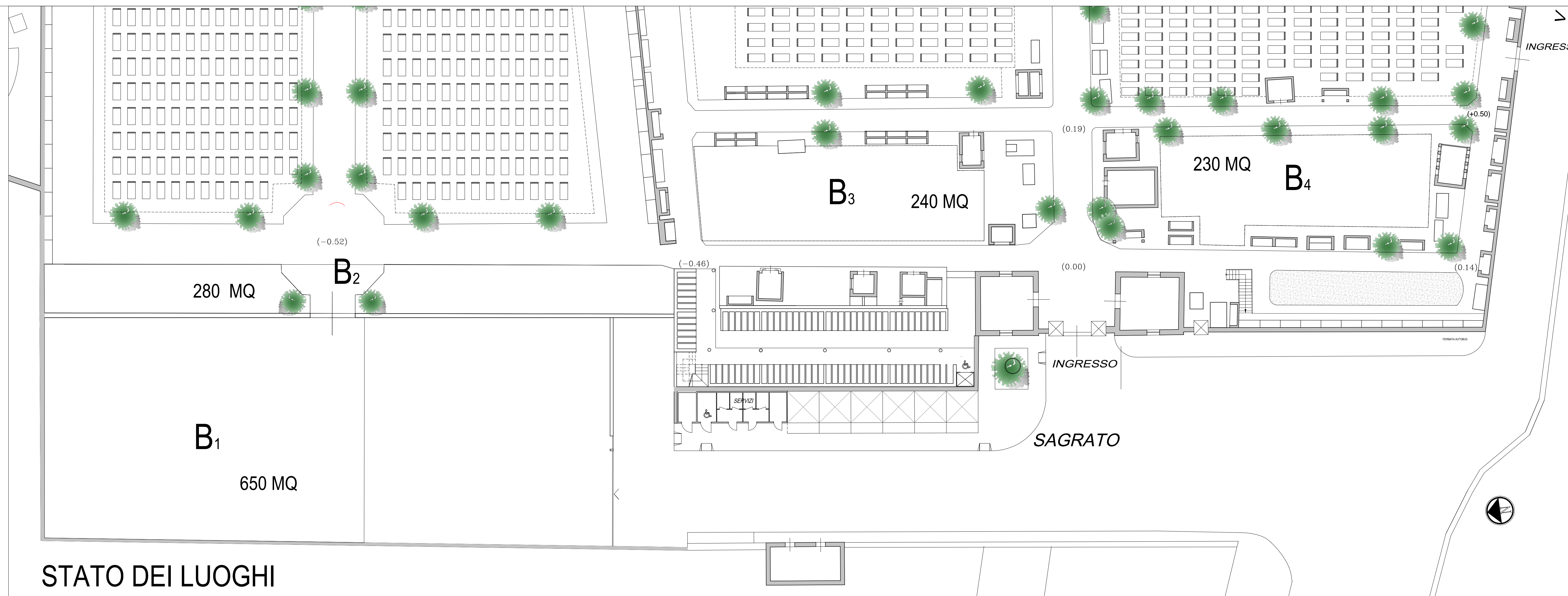
STATO DEI LUOGHI